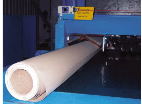
Eenvoudige invoer voor kokers.

*Capaciteit afhankelijk van materiaal en toevoer.